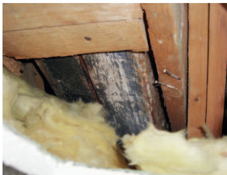
Fuktskador och träskyddsbehandlat trä bakom kontorsväggarna.

Den grundläggande delen i utredningen av huruvida en invändig tilläggsisolering