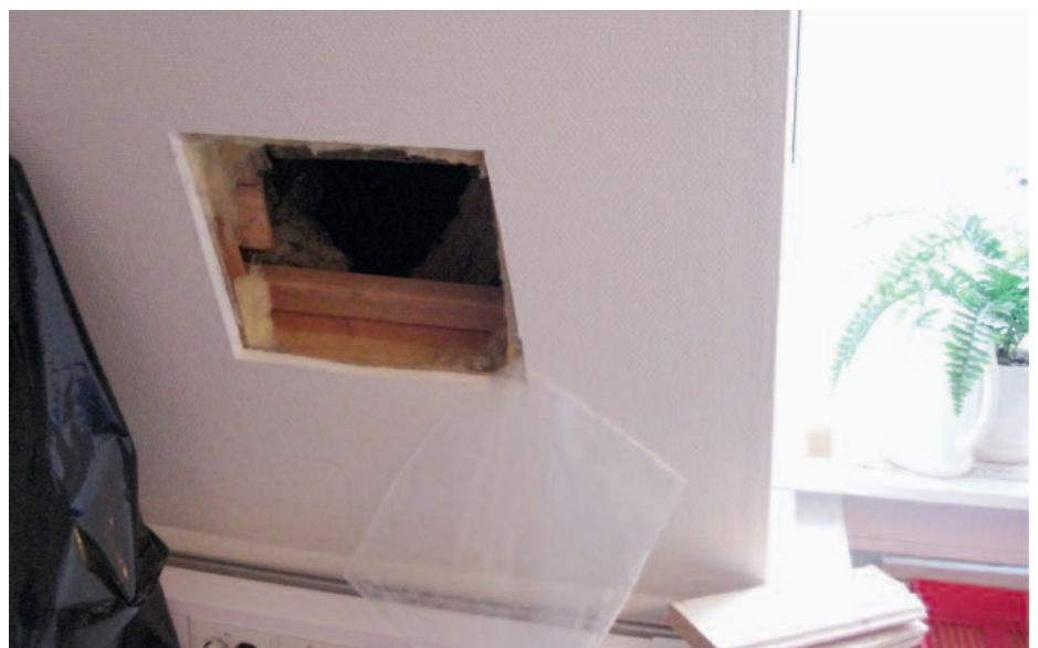
Konstruktionsingrepp i ombyggd industrifastighet. Byggnaden anpassad till kontorsverksamhet.